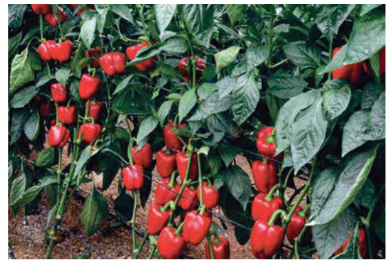
Merkava es capaz de desarrollar el ciclo productivo más largo del mercado.

quincena de julio y es capaz de desarrollar "el ciclo productivo más largo del mercado", apuntan desde Zeraim Ibérica, gracias al equilibrio y capacidad de cuaje de su planta, capaz de tener una buena respuesta con calor y una excepcional finalización del ciclo