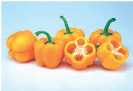
Laurentia destaca por su alta uniformidad de calibre G-GG.

Laurentia, la variedad de 'calibre ganador', recomendada para plantaciones desde el 10 al 25 de julio, destaca por su alta uniformidad en calibre G-GG y forma a lo largo de todo su extenso ciclo productivo, así como por su color amarillo limón y su especial conveniencia para el flow-pack.